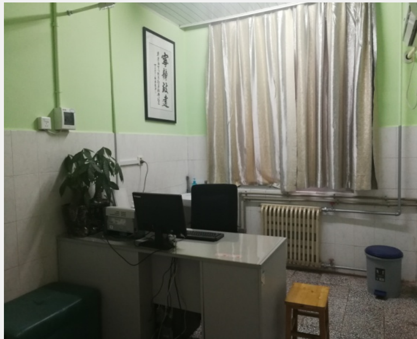
淋巴水肿接待看诊室