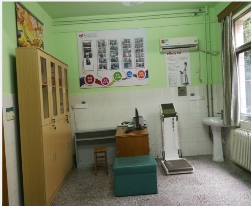
淋巴水肿功能锻炼室