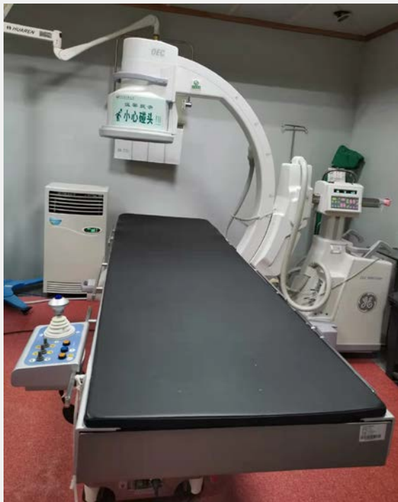
置管后导管尖端定位仪器